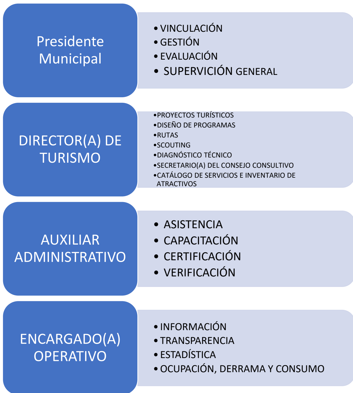
Ilustración 2 Responsabilidades de la Dirección de Turismo